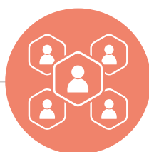
La loyauté dans les relations internes et externes