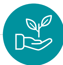
La Responsabilité Sociale et Environnementale