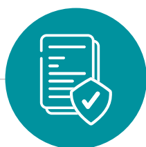
Le respect des lois mais aussi des normes propre à chaque secteur