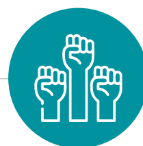
Le respect des droits humains